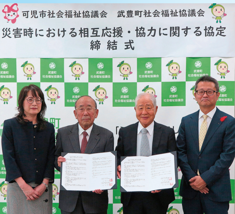
↑武豊町社協との 協定の様子

愛知県武豊町社会福祉協議会と多治見市社会福祉協議会それぞれと災害に備えて、 相互に応援するため「災害時における相互応援・協力に関する協定」を結びました。