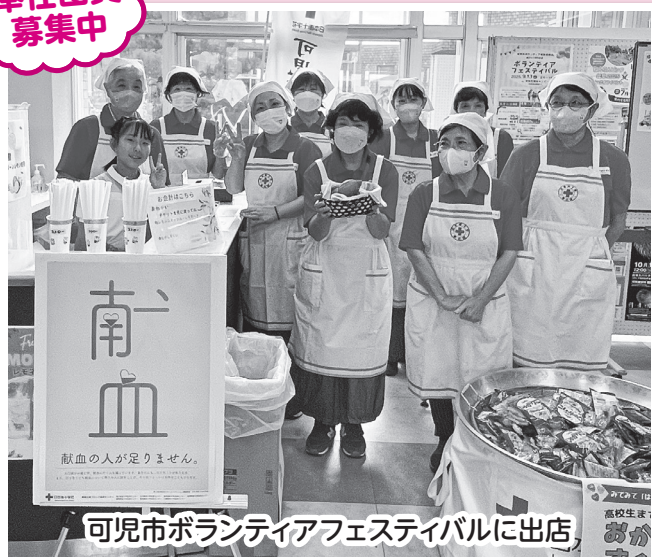
可児市ボランティアフェスティバルに出店