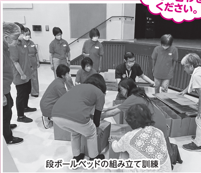
段ボールベッドの組み立て訓練