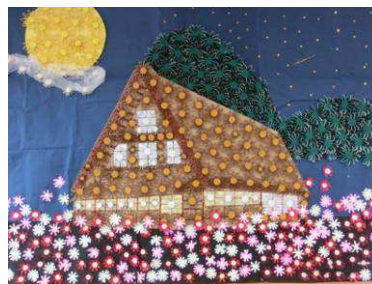
壁面作り「世界遺産 合掌作り」