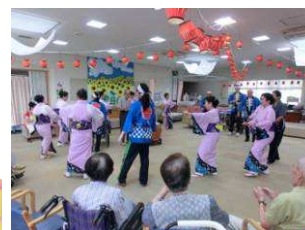
お楽しみ会 夏祭り